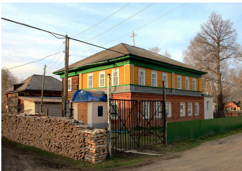
Фото 3.5-3. Церковь Николая Чудотворца в д. Павлово (2015 г.) 43 .