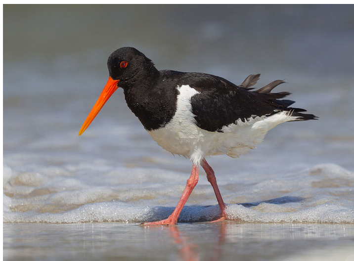
Фото 2.5-2. Кулик-сорока