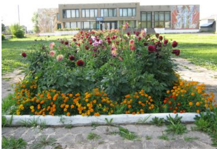
Фото 3.5-2. Павловский сельский центр досуга 42 .