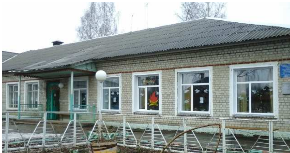
Фото 3.5-1. Павловская основная общеобразовательная школа 40 .