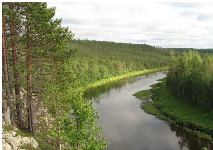
Фото 2.5-1. Река Пижма

Шесть видов заказника (зеленая жаба, черная крачка, белокрылая крачка, прудовая ночница, ночница Брандта, бурый ушан) внесены в Приложение 2 Красной книги Кировской области, как уязвимые, нуждающиеся в контроле состояния популяций.