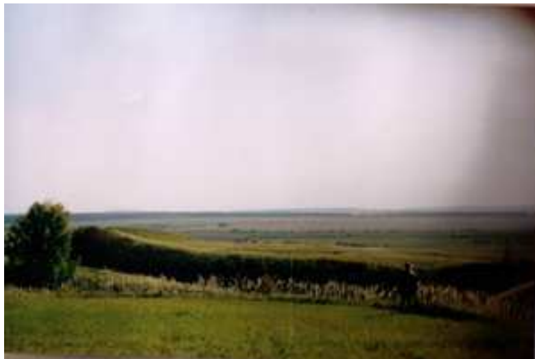
Фото 1-1. Ижевское городище 7 .

На территории Ижевского СП обнаружено множество археологических находок, начиная с IV тысячелетия до нашей эры (см. табл. 1-2), в т.ч. Ижевское городище (см. фото 1-1). Первыми жителями, заселявшими территорию Пижанского района были племена удмуртов. Затем их вытеснили племена мари, а в XVI в. появились русские.